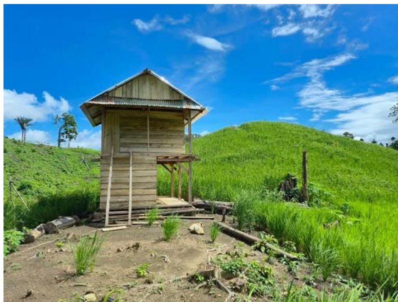
Gambar 1. Pertanian Jagung Hibrida Kelompok Tani Masilanta Desa Matanauwe (Dokumentasi Penulis, 2025)

melalui penyediaan alat pertanian sederhana dan bantuan bibit. Bantuan ini dimaksudkan untuk mendorong produktifitas kelompok tani sekaligus mengurangi beban biaya produksi yang ditanggung petani. Dengan adanya dukungan tersebut, kelompok tani desa Matanauwe ini memiliki modal awal yang lebih kuat dalam mengelola lahan, sehingga mampu mempertahankan aktivitasnya secara berkelanjutan.