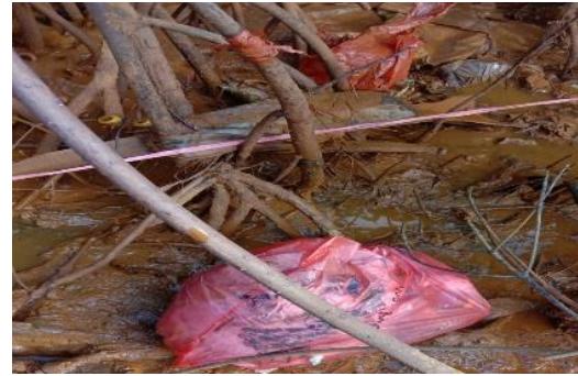
Gambar 3. Kondisi Ekosistem Hutan Mangrove Akibat Pembuangan Sampah

Terkait dengan pertanyaan yang diajukan pada Tabel 8, kepala desa dan wirausaha menjawab masyarakat membuang sampah di sekitar kawasan ekosistem hutan mangrove . Hal ini bisa dilihat dari banyaknya sampah yang ada di kawasan tersebut, bahkan sampah juga berasal dari aliran sungai dan juga laut.