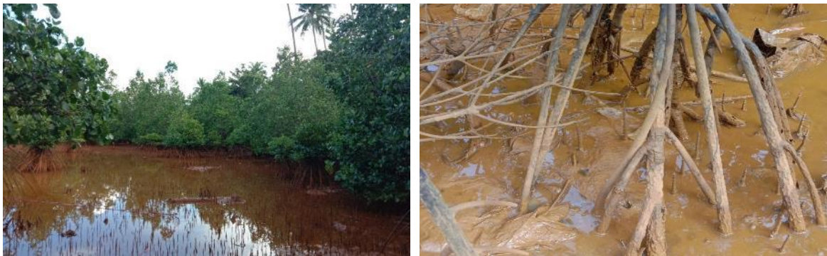
Gambar 2. Kondisi Ekosistem Hutan Mangrove Akibat Aktivitas Pertambangan Nikel